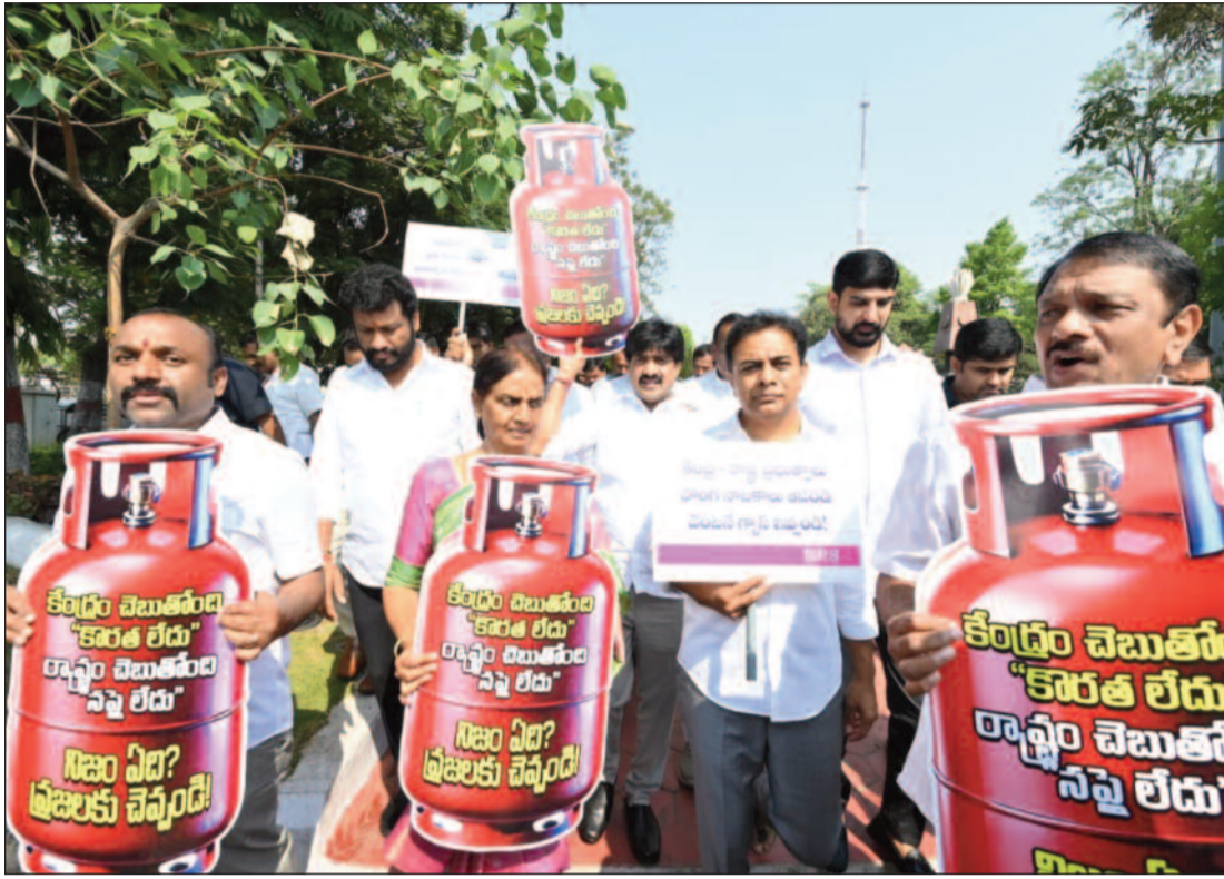
ప్రశ్నించే గొంతులపై కాంగ్రెస్ కత్తి

వ్రజా దీవెన, హైదరాబాద్ : 'గ్యాస్ కొరత లేదని కేంద్ర ప్రభుత్వం బుకాయస్తుంటే.. సప్లయ్ లేదని తెలంగాణలోని కాంగ్రెస్ ప్రభుత్వం రాష్ట్ర ప్రజలను మభ్యపెడుతున్నది' అని బీఆర్ఎస్ వర్కింగ్ ప్రెసిడెంట్ కేటీఆర్ విమర్శించారు. ఆంధ్రోత్సవ కొట్లాటలో లోగలు బలైన చందంగా కేంద్ర, రాష్ట్ర ప్రభుత్వాల నాటకాలకు సామాన్యులు బలైపోతున్నారని ఆవేదన వ్యక్తం చేశారు. మంగళవారం గన్పార్క్ వద్ద బీఆర్ఎస్ ఎమ్మెల్యేలు, ఎమ్మెల్సీలతో కలిసి గ్యాస్ కొరతపై నిరసనకు దిగారు. 'కేంద్రం చెబుతుంది కొరతలేదు.. రాష్ట్రం అంటుంది సప్లయ్ లేదు.. నాటకాలు ఆపండి.. గ్యాస్ కొరత తీర్చండి' అంటూ నినాదాలు చేశారు. ప్రకారంలోని ప్రదర్శనలూ ఆసెంబ్లీలోనికి వెళ్లారు. ఈ సందర్భంగా కేటీఆర్ మాట్లాడుతూ ఆమెరికా-ఇజ్రాయేల్, ఇరాన్ యుద్ధం ప్రారంభమైన తర్వాత గ్యాస్ సిలిండర్ కోసం ప్రజలు అష్టకష్టాలు పడుతున్నారని పేర్కొన్నారు. పనులు బంద్ పెట్టి గ్యాస్ ఏజెన్సీల వద్ద పడిగావులు కాయాలైన దుస్థితి నెలకొన్నదని వాపోయారు. ఇప్పటికైనా మోడీ, రేవంత్ ప్రభుత్వాల కండ్లు తెరిచి ముందస్తు జాగ్రత్త చర్యలు తీసుకొని ఎల్ఐపీజీ గ్యాస్ను అందుబాటులోకి తేవాలని డిమాండ్ చేశారు.