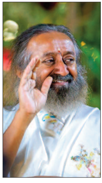
- గురువే శ్రీ శ్రీ రవిశంకర్ శ

ఒక మంచి పని చేయడానికి మి ముల్తు ఒక మంచి స్థానంలో ఉంచింది దైవమే. అందుకే, "ఇచ్చేవాడు కృతజ్ఞతతో ఉండాలి" అని అంటారు. మీరు ఏదైనా ఇచ్చి, అది స్వీకరించబడినప్పుడు, మీరు కృతజ్ఞతతో ఉంటారు; "ఓహో, నేను ఇవ్వగలిగే స్థితిలో ఉంచబడ్డాను. ఒకవేళ దేవుడు నన్ను కేవలం తీసుకోవడానికి అవతలి వైపు ఉంచి ఉంటే?" అప్పుడు అంత మంచిది కాదు. కాబట్టి నాకు ఇచ్చే స్థానం ఇవ్వబడింది - అదే ఒక గొప్ప విషయం. మీ కానుకలు స్వీకరించబడుతున్నాయి - దానికి మీరు కృతజ్ఞతతో ఉండాలి. మీ అంత గం లోని ఆత్మ, ఆనకల ప్రపంచానికి ప్రభువు. మరియు ఆయనే పుణ్య కార్యాల ప్రపంచాన్ని ఆనందిస్తాడు. మరియు ఆయన ఎల్లప్పుడూ అందరికీ మేలు జరగాలని కోరుకుంటాడు. శ్రేయస్సు యొక్క లోతై న భావన, దయ అనేవి ఆత్మనుం డి, దైవం నుండి వస్తాయి. కాబట్టి ఆ మంచి పనికి అతుక్కుపోకండి; "ఓహో, నేను ఎంత మంచివాడిని". మంచివాడు ఎవరు? మీరు మంచి వారు కాదు, కేవలం దేవుడు మాత్రమే మంచివాడు. ఏ మంచితన మైనా దైవత్యమే, ఏ మంచితన మైనా దైవత్యమే. ఇది తెలుసుకుని, మీరు శాంతితో విశ్రమిస్తారు. మరియు దైవభక్తి లేదా మంచితనం ఎన్నటికీ నశించదు, ఎందుకంటే అది శాశ్వతమైనది.