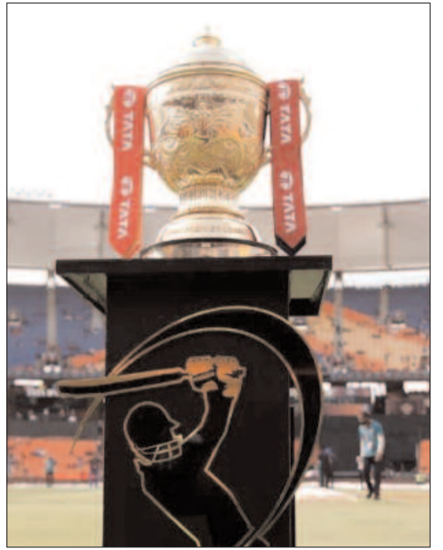
పరుగులతో సన్ రైజర్స్ హైదరాబాద్ పైచేయిగా నిలిచింది. బెంగళూరు జట్టు 68 పరుగులు చేసి రెండో స్థానంలో నిలిచింది.

చేసుకుంది. బెంగళూరు చిన్నస్వామి స్టేడియం వేదికగా 2024 ఐపీఎల్ సీజన్లో మార్చి 30వ తేదీన హైదరాబాద్ చారిత్రక రికార్డు సృష్టించింది. మూడు వికెట్లను కోల్పోయిన హైదరాబాద్ జట్టు ఐపీఎల్ లోనే అత్యధికంగా 287 పరుగులు సాధించి సరికొత్త రికార్డును క్రియేట్ చేసింది. ఆ మ్యాచులో హైదరాబాద్ ఆటగాడు... ట్రావిస్ హెడ్ 41 బంతల్లో అద్భుతమైన సెంచరీ చేసి ఆ మ్యాచులో రాయల్ ఛాలెంజర్స్ బెంగళూరు జట్టు ఏడు వికెట్ల సమైక్యంగా 262 పరుగులతో సరిపెట్టుకుంది. ఐపీఎల్ లో గడిచిన 24 మ్యాచుల్లో విన్సింగ్ హిస్టరీని పరిశీలిస్తే... రాయల్ ఛాలెంజర్స్ పై సన్ రైజర్స్ హైదరాబాద్ దే పైచేయిగా ఉంది. ఫస్ట్ బ్యాటింగ్ అయినా... లక్ష్యాన్ని చేదించే సమయంలోనూ బెంగళూరు జట్టుపై హైదరాబాద్ జట్టే విజయవంతాకాలను చేజిక్కించుకుంది. 24 మ్యాచుల్లో 13 మ్యాచులను సన్ రైజర్స్ హైదరాబాద్ పైచేయి సాధిస్తే... 11 మ్యాచులను రాయల్ ఛాలెంజర్స్ బెంగళూరు విజయం సాధించింది. సన్ రైజర్స్ 166 సగటు పరుగులు కాగా... బెంగళూరు జట్టు సగటు పరుగులు 162గా నమోదైంది. జట్టు పరంగా అత్యధిక స్కోరు సాధనలోనూ సన్ రైజర్స్ హైదరాబాద్ జట్టే 287 పరుగులతో అగ్రస్థానంలో నిలిచింది. 262 పరుగులతో బెంగళూరు జట్టు తర్వాత స్థానంలో నిలిచింది. అత్యల్ప స్కోరు సాధనలోనూ 72