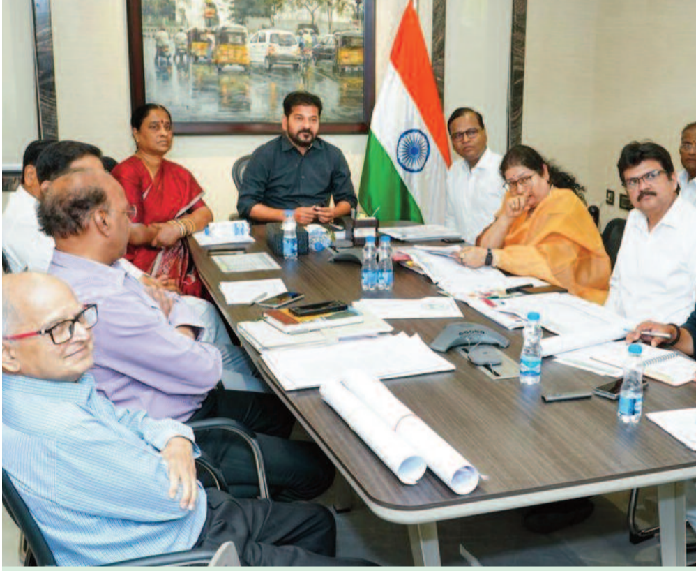
నేడు హైకోర్టు జోన్-2 హైదరాబాద్ కు చేరుకున్న సుప్రీం భవన శంకుస్థాపన కోర్టు చీఫ్ జస్టిస్ సూర్యకాంత్

రేపు సీఎం చేతుల మీదుగా భూమిపూజ రాష్ట్రంలోని ఆలయాల పరిసరాల్లో.. ఇకపై తిరుమల తరహా నిబంధనలు రాజకీయ పార్టీల సభలు, ప్రదర్శనలు, జెండాలు లేకుండా ఆధ్యాత్మికతకు పెద్దపీట ఎంతటి వీణపీలైనా ఆలయ ప్రాంగణంలోకి వాహనాలకు నో ఎంట్రీ: సీఎం రేవంత్ రెడ్డి ఆలయ అభివృద్ధి పనులపై సమీక్ష