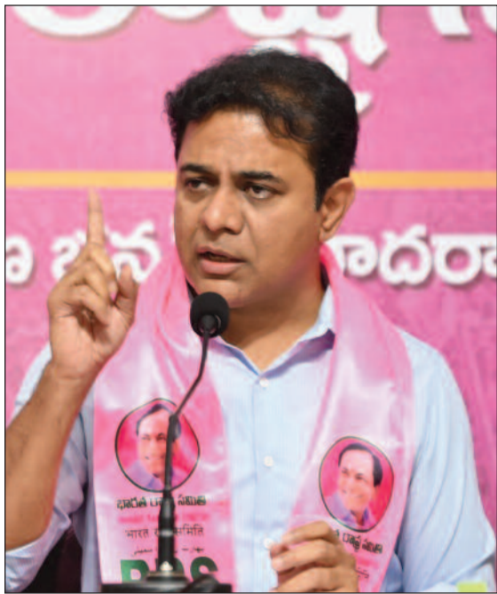
మండిపడ్డారు. మహిళా రిజర్వేషన్ బిల్లుకు తమ పార్టీ సంపూర్ణ మద్దతు ఇస్తుందని.. అయితే, దానిని

మహిళా రిజర్వేషన్లను డీలిమిటేషన్తో ముడిపెట్టాడు రేవంత్ హైబ్రైడ్ సీఎం.. ఆయన పాలనా అలాగే ఉంది బీఆర్ఎస్ వర్కీంగ్ ప్రసిడెంట్ కేటీఆర్ కేటీఆర్ విమర్శలు