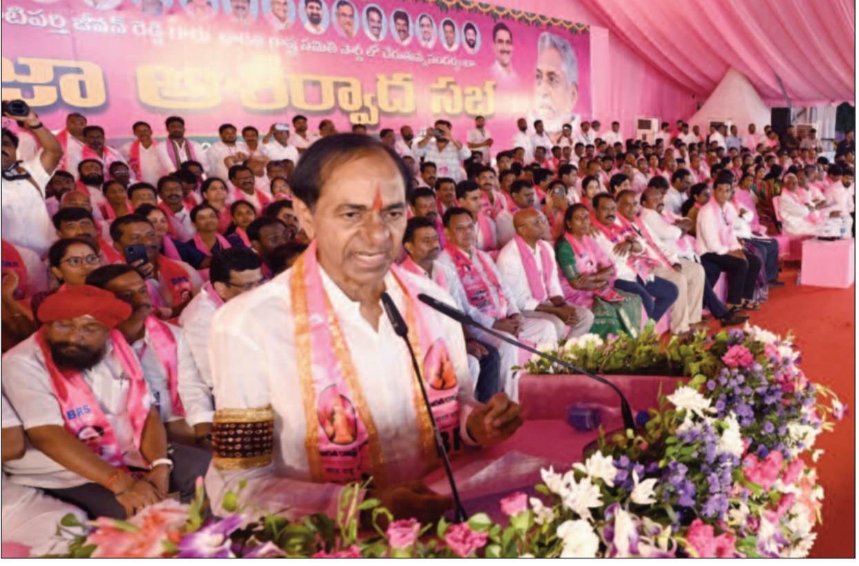
కాకుండా తొలి పదేళ్లలో దేశంలోనే నంబర్ వన్ గా నిలుపుకోగలిగామని అన్నారు.

పొద్దున లేస్తే కేసీఆర్ చావాలని అంటారా! ఈ వెధవలు చావాలని పదేపదే అంటే కేసీఆర్ చస్తాడా? ఇక్కడి దరిద్రం పోయేదాకా పనిచేస్తానే ఉంటా కాంగ్రెస్ హయాంలో కుంభకోణాలు తప్ప.. అభివృద్ధి లేదు ఓట్లనే ముందు అలోచించడని అప్పుడే చెప్పాను తప్పు చేశామని ప్రజలు ఇప్పుడు బాధపడుతున్నారు భూముల ధరలు అప్పుడెలా ఉండేవి? ఇప్పుడెలా ఉన్నాయి? రైతుబంధుకు రాం రాం.. దళిత బంధుకు జై భీమ్ మూసీ వెంట గరిబోళ్లను ఏడిపిస్తున్నారు బీఆర్ఎస్ అధికారంలోకి రాగానే హైద్రాబాద్ ఎత్తేస్తాం జగిత్యాల సభలో కేసీఆర్.. బీఆర్ఎస్లో చేరిన జీవన్ రెడ్డి రాష్ట్రానికి పట్టిన శని పోషడానికి కేసీఆర్ తో కలిశా: జీవన్ రెడ్డి కరీంనగర్, ఆదిలాబాద్, నిర్మల్ ప్రాంతాల్లోనూ జీవన్ రెడ్డి ప్రభావం