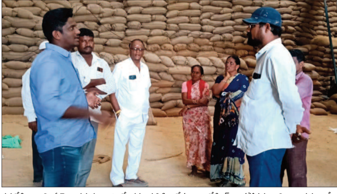
పర్యవేక్షించాలని, ఏవైనా సమస్యలు ఉంటే తమ దృష్టికి తీసుకురావాలని ఆయన ఆదేశాలు జారీ చేశారు. ఎక్కడ అనవసరంగా కొనుగోలు నిలిచిపోవడం, లేదా లారీలు లేకుండా లోడింగ్ కాకపోవడం, మిల్లుల వద్ద లారీలు అన్నోడింగ్ కోసం ఆగి ఉండటం వంటివి జరగకూడదని ఆయన స్పష్టం చేశారు.