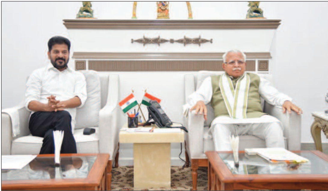
మొదటి ఫేజ్ తరువాతి

చెందుళ్ళు హైదరాబాద్ నగరంలో ప్రయాణికుల సౌకర్యం మెట్రోను మరింతగా విస్తరించాల్సిన అవసరం ఉందని తెలిపారు. ఫేజ్-2, ఫేజ్-3 విస్తరణ సజావుగా