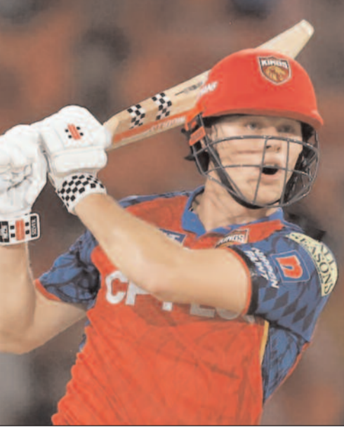
తర్వాత ఈ లిస్ట్లో వరుసగా డేవిడ్ మిల్లర్ (101), హామీమ్ ఆమ్లా (100), మయంక్ అగర్వాల్ (100) ఉన్నారు.కాగా, పంజాబ్ కింగ్స్ తరపున 22వేళ్లకే సెంచరీ బాదిన రెండో బ్యాటర్గా కనోలి నిలిచాడు. అతడి కంటే ముందు ప్రభా?సిప్రాన్ సింగ్ ఈ ఫీట్ సాధించాడు. ప్రభా?సిప్రాన్ 2023 ఎడిషన్లో దిల్లీ క్యాపిటల్స్పై సెంచరీ చేశాడు. అలాగే ఇదే ఏళ్లలో పంజాబ్ కింగ్స్? తరపున సింగిల్ ఎడిషన్లో అత్యధిక సిక్సర్లు బాదిన ఆటగాడిగానూ రికార్డు కొట్టాడు. ఈ మ్యాచ్లో కనోలి 8 సిక్సర్లు బాదాడు. ఇదివరకు కూడా ఈ రికార్డు కనోలి పేరిటే ఉంది. ఇదే సీజన్లో లభో?నవూతో మ్యాచ్లో 7 సిక్సర్లు బాదాడు.