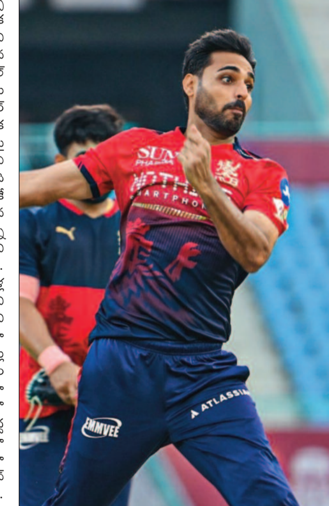
భారత క్రికెట్ లో భువనేశ్వర్ కుమార్ ఒక సైరెంట్ వారియర్ లాంటివాడని, ఎన్ని కొత్త టెక్నాలజీలు వచ్చినా, ఎంతమంది కొత్త బౌలర్లు వచ్చినా భువీ తన స్పింగ్ తో బ్యాటర్లను పణికించగలడని విశ్లేషకులు ప్రశంసిస్తున్నారు. 200 మ్యాచ్ లు ఈ మైలురాయి అతని హాల్ వర్క్ కు నిదర్శనమని గుర్తు చేస్తున్నారు.