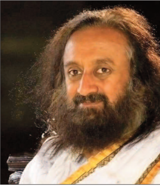
- గురుదేవ్ శ్రీ శ్రీ రవి శంకర్ జీ

మీ స్వతి దేవుని కోసం కాదు. ఇది మీ కోసమే. మీరు భగవంతుని స్తుతిస్తారు, ఆయన మీ ఆత్మను ఉద్ధరిస్తాడు. ఆ మంచి గుణాలన్నింటి నీ మీరే బయటకు తీసుకువస్తారు. స్తుతింపబడటంతో భగవంతుడు చాలా సంతోషించి మీకు ఆశీర్వాదం ఇస్తాడని కాదు. మీరు ఈ విధంగా భగవంతునికి లంచం ఇవ్వలేరు. మనం భగవంతునికి ప్రార్థన చేస్తాము. మనం ప్రతి మతంలోనూ ఇది చేస్తాము. ప్రార్థించడం ద్వారా మనం భగవంతుని సంతోషపెడుతున్నామని, ప్రార్థించకపోతే భగవంతునిపై కోపంగా ఉన్నామని మనం అనుకుంటాము. నేను అలా అనుకోను. ప్రార్థన మీ జన్మ వాణి. మీకు ఏదైనా కావాలంటే ప్రార్థిస్తారు. ధ్యానం ప్రార్థన కంటే కూడా శ్రేష్టమైనది. ప్రార్థన యొక్క అంతం ధ్యానం అయి ఉండాలి. ధ్యానం అంటే భగవంతునితో, "నేను నీ మాట వినడానికి ఇక్కడ ఉన్నాను. నీవు నాకు ఏమి చెప్పాలనుకుంటున్నావు? నీ కోరిక నెరవేరాలి" అని చెప్పడమే. ఇదే ధ్యానం.