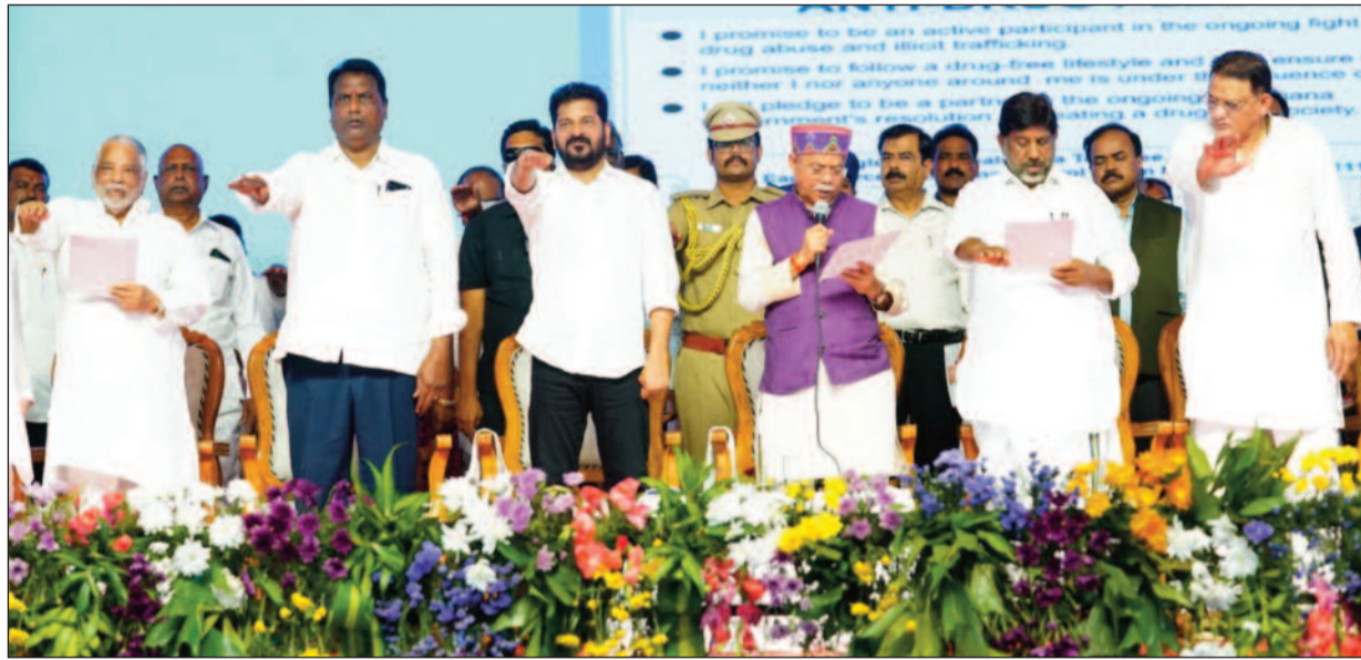
కార్యక్రమంలో గవర్నర్ శివ ప్రతాప్ శుక్లా, ఎంపీలు, ఎమ్మెల్యేలు పాల్గొన్నారు.